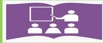
स्वास्थ्य शिक्षा तथा परामर्श