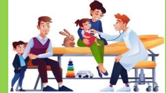
सामान्य स्वास्थ्य परीक्षण